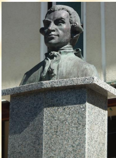
Born Ignác mellszobra Kapnikbányán

Az előadások napjának a Zazár jobb parti oldalán lévő Teleki-ház adott rangos, igényes és nagybányai hangulatú otthont. A három ipartörténeti előadást, öt számtan-, három