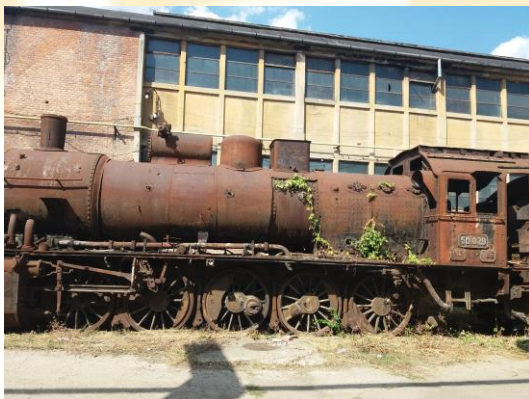
2. kép. Rozsdatemető