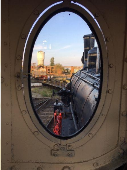
1.kép. Már nem fűtül a mozdony

Péntek délutánra „üzemlátogatás” szerepelt az előzetes programban. Elsőnek a kolozsvári vasúti gördülőanyagot javító és gyártó Remarul Február 16 vállalatot látogatták meg a konferencia résztvevői. A vállalat a kincses város egykor nagy tekintélynek örvendő ipari múltjának egyik ritka túlélője. 1870-ben alapították, egyidőben a Nagyvárad–Kolozsvár–Brassó vasútvonal építésével. 90 alkalmazottal indult, hogy az 1970-es évekre elérje tevékenysége csúcspontját. Ekkor 2700 dolgozót foglalkoztatott. Az ezredforduló környékén a visszaesett vasúti közlekedés a csőd szélére sodorta a céget. Jelenleg 340-en dolgoznak a műhelyekben, vasúti kocsikat, mozdonyokat újítanak fel.