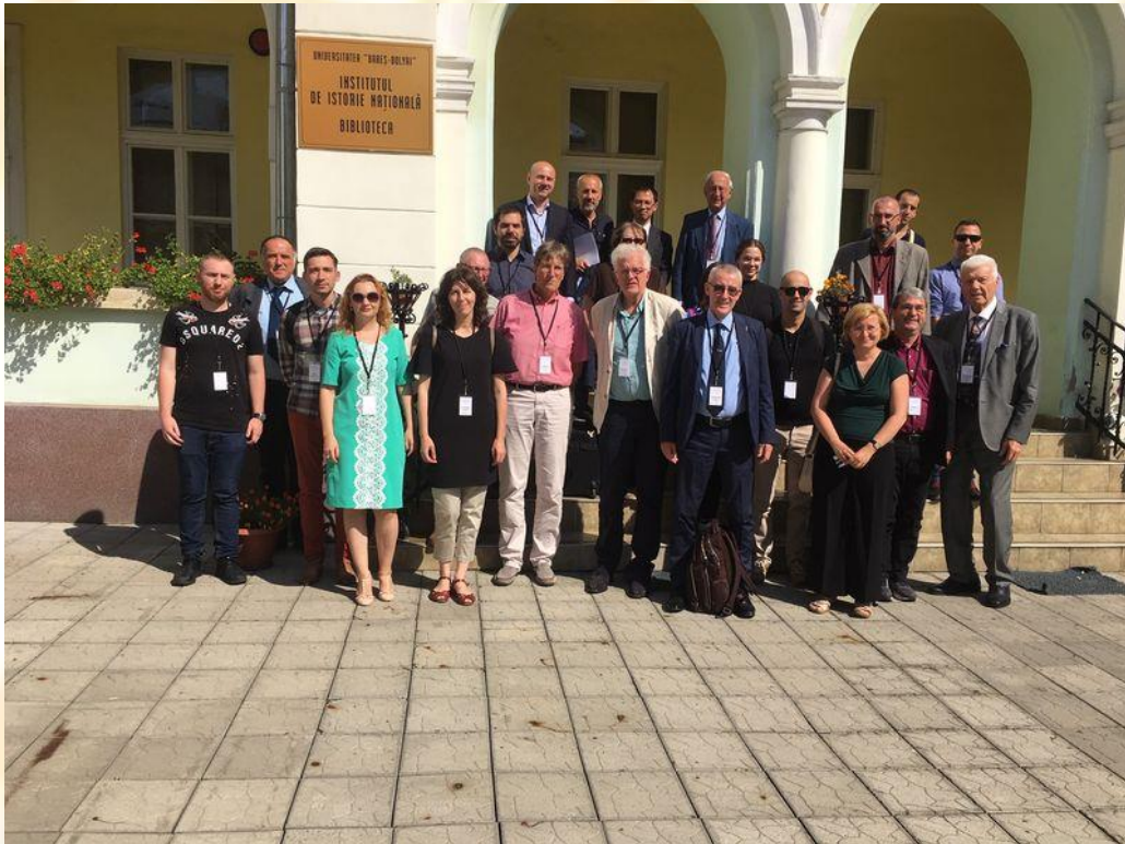
3. kép. A konferencia résztvevői