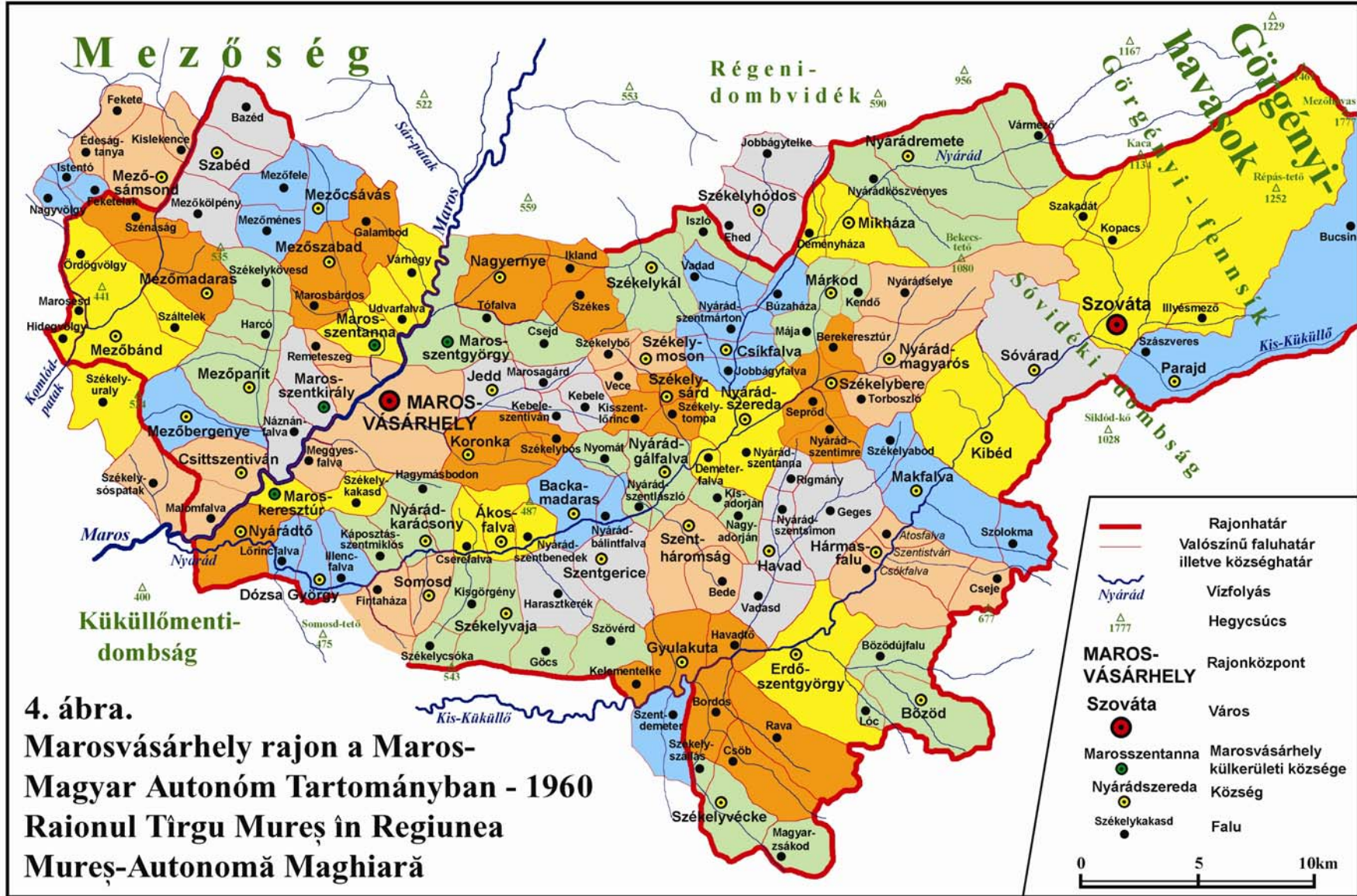
4. ábra. Marosvásárhely rajon a Maros- Magyar Autonóm Tartományban - 1960 Raionul Țirgu Mureș în Regiunea Mureș-Autonomă Maghiară