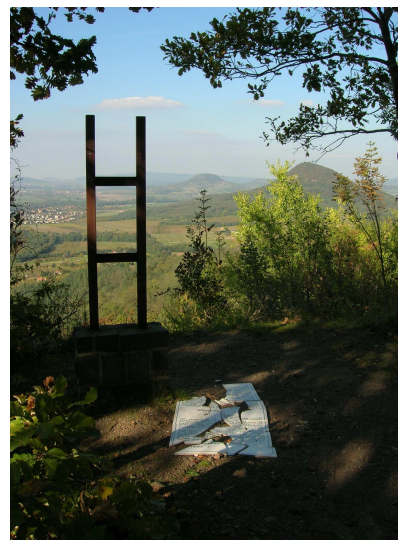
2. ábra. A vandalizmus nyomai a Badacsony hegyen vezető tanösvényen